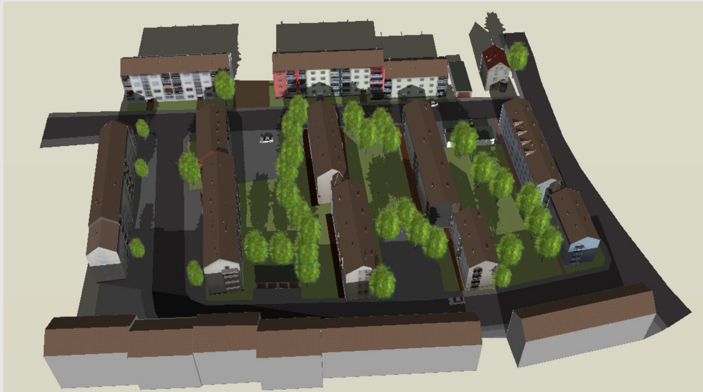
3D-Modell Schrägansicht Sketchup